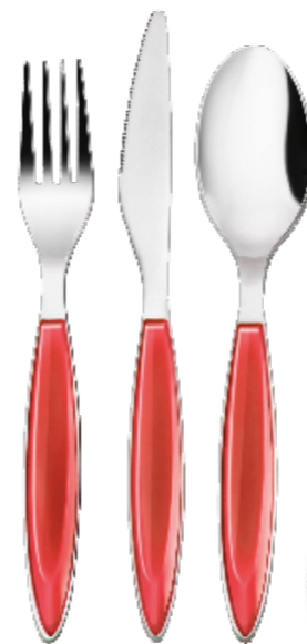
Besteck-Sets von Gnali & Zani aus Italien gibt es ebenfalls in Hildesheim

IN KÜRZE: Im Fachgeschäft Ambiente Gourmet in Hildesheim gibt es rund 7.000 Artikel für die Küche. Geschenkörbe und eine nette Verpackung gehören zum Service ebenso wie gute Beratung, viel Herzblut und eine enge Kundenbindung.