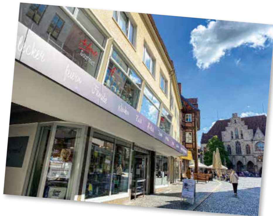
Das Fachgeschäft liegt zentral, direkt am historischen Marktplatz von Hildesheim