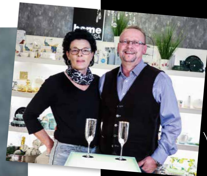
Die unterschiedlichsten Geschenke-Körbe kommen gut an