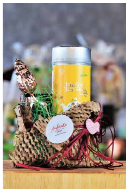
Noch kein Geschenk? Bei Ambiente Gourmet findet sich für jeden Anlass etwas

Sand. Sie wollen auf jeden Fall weitermachen und kämpfen engagiert für den Erhalt ihres Ladens, dessen Türen sie hoffentlich bald wieder dauerhaft öffnen können, um auf ihren rund 180 Quadratmetern endlich wieder über 7.000 Artikel präsentieren zu dürfen. Um dem Kunden die richtigen Küchenmaschinen, Messer, Töpfe oder Pfannen zu verkaufen, mit denen er auch glücklich wird, braucht es eine gute Beratung, das geht nur stationär und vor Ort. „Wir lieben unseren Laden, wir möchten, dass die Leute gerne kommen, hier stöbern, gut beraten werden, wir leben einfach auch gerne diese analoge Welt“, gibt Wechler offen zu. Das Fachgeschäft ist eine wahre Fundgrube für alle, die sich gern mit dem Thema gutes Essen, schöne Dinge, Küche als Erlebniswelt und das einfache wie raffinierte Zubereiten von Speisen befassen und sich inspirieren lassen wollen.