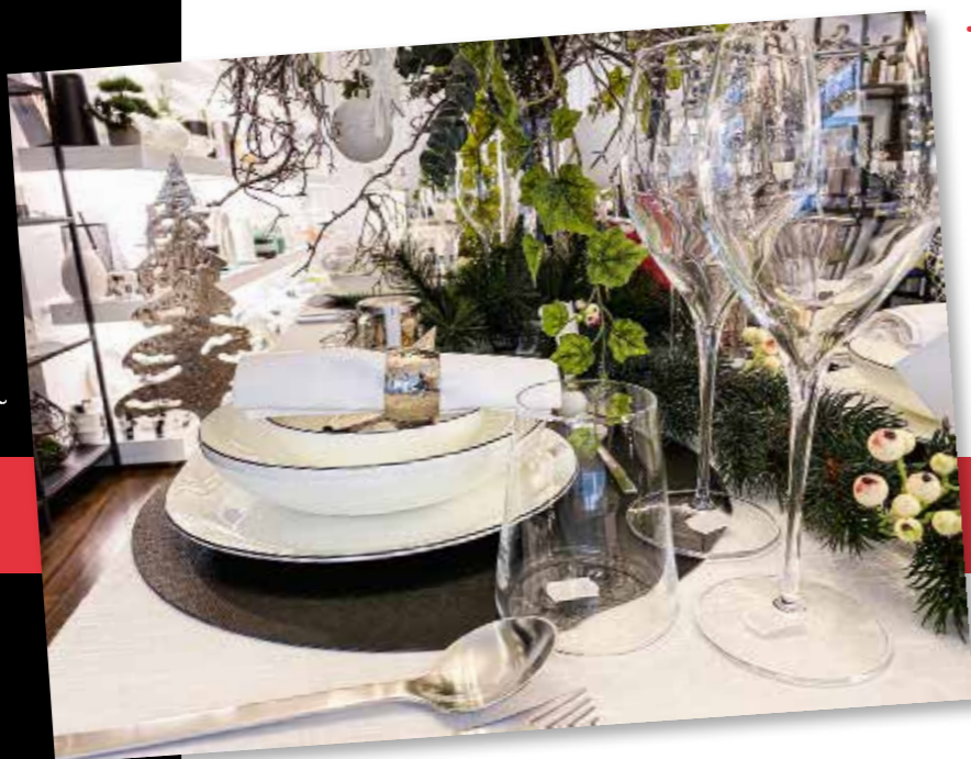
Schön gedeckte Tafeln inspirieren die Kunden

ten zusammen, die wir schon lange kennen und die uns besuchen,“ meint Wechler. Der Corona-Krise und all ihren Auswirkungen zum Trotz will das Ehepaar wirklich alle Hebel in Bewegung setzen, um den Fortbestand von Ambiente Gourmet in Hildesheim zu gewährleisten. Die Kunden wissen das Engagement zu schätzen und unterstützen den Fachhandel nach Kräften, denn wie öde wären unsere Innenstädte, wenn nach der Pandemie alle schönen Läden dauerhaft geschlossen blieben? www.ambiente-gourmet.de