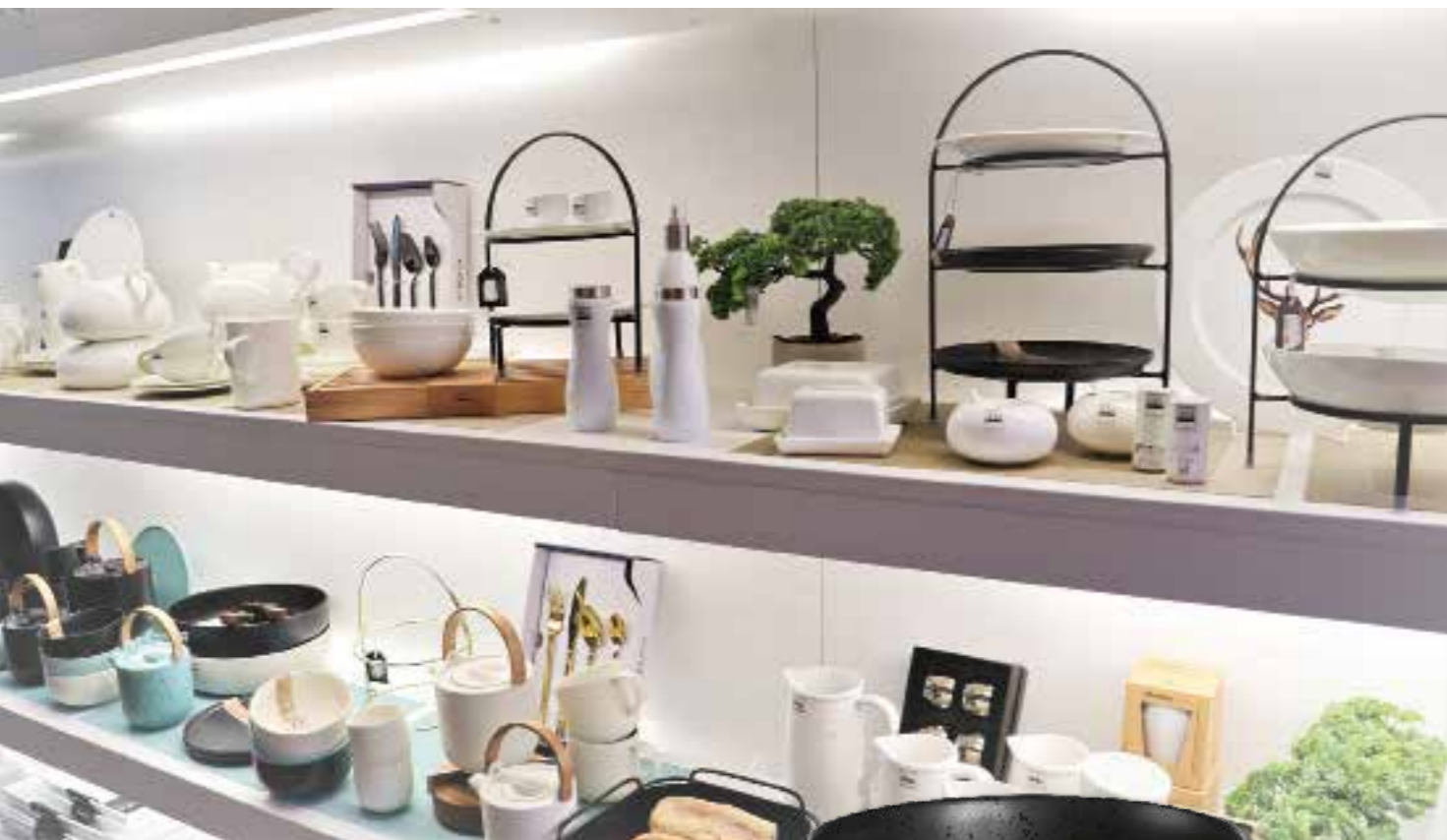
Ein breites Sortiment für den gedeckten Tisch

Gute Laune, Spaß an hochwertigen Produkten und kenntnisreiche Beratung gibt es im Fachgeschäft für gehobenen Küchenbedarf, Gourmet- und Geschenkartikel „Ambiente Gourmet“ in Hildesheim garantiert gratis zum Einkauf dazu! Umdenken, Neues ausprobieren und dabei immer den Kunden im Blick haben, darauf bauen die Inhaber Dagmar und Marc Wechler.